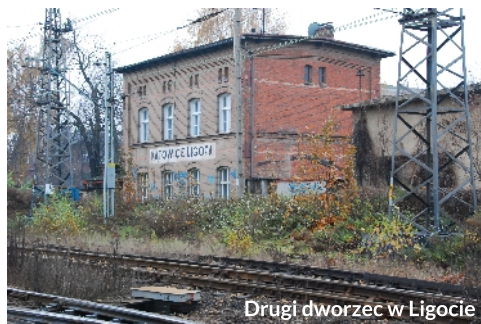
Drugi dworzec w Ligocie

Ważnym wydarzeniem w dziejach Ligoty było otwarcie 1 grudnia 1852 roku linii kolejowej, która wiodła z Katowic przez Ligotę do Kopalni Węgla Kamiennego „Emanuelsgen” w Murckach. Od linii poprowadzono w Ligocie znaną nam już bocznice Idaweiche, która wiodła do Huty „Ida”. Wybudowano również kolejowy posterunek odgałęźny, który z czasem uzyskał rangę przystanku osobowego. Był to pierwszy dworzec