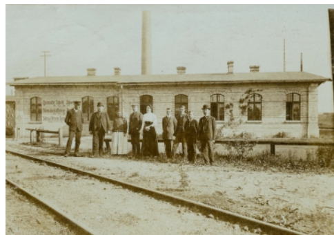
Pierwszy dworzec w Ligocie