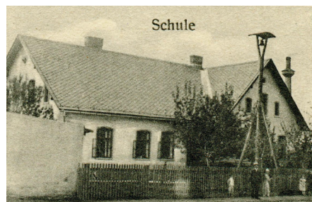
Pierwsza szkoła w Ligocie. Fragment pocztówki z początku XX wieku