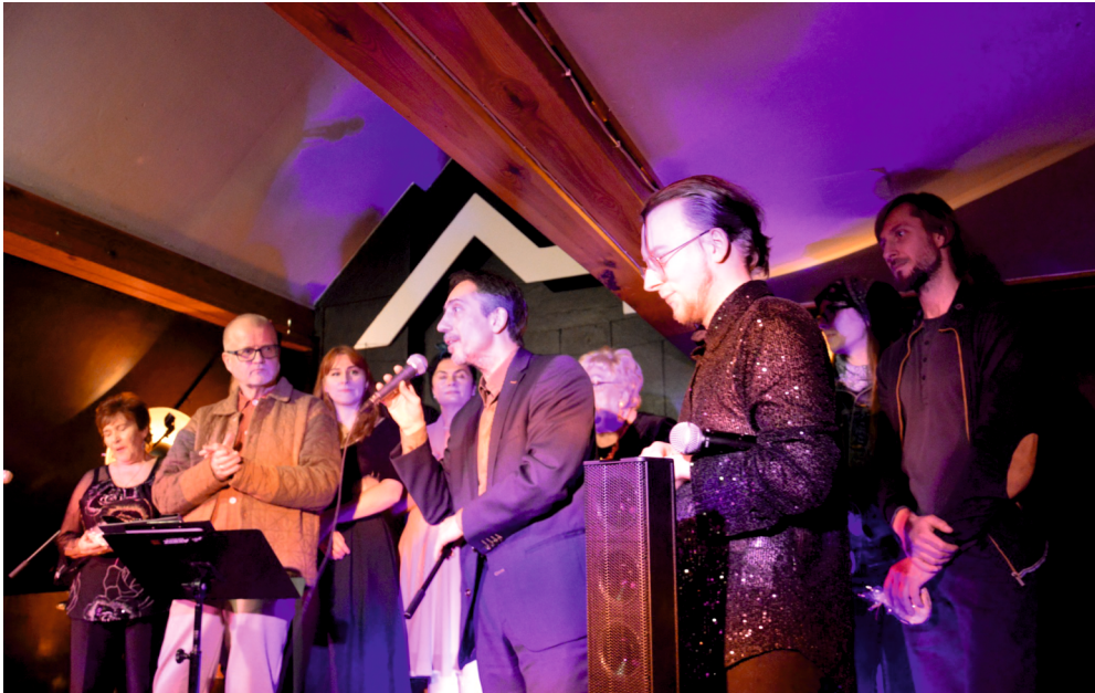
Koncert „W karnawałowej tonacji”