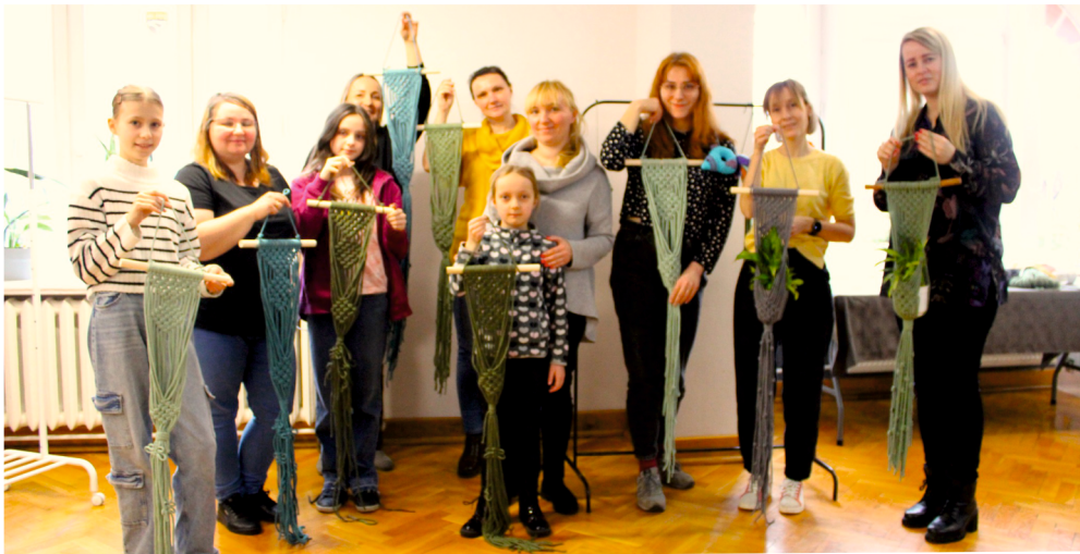
Warsztaty tworzenia makramowych kwietników